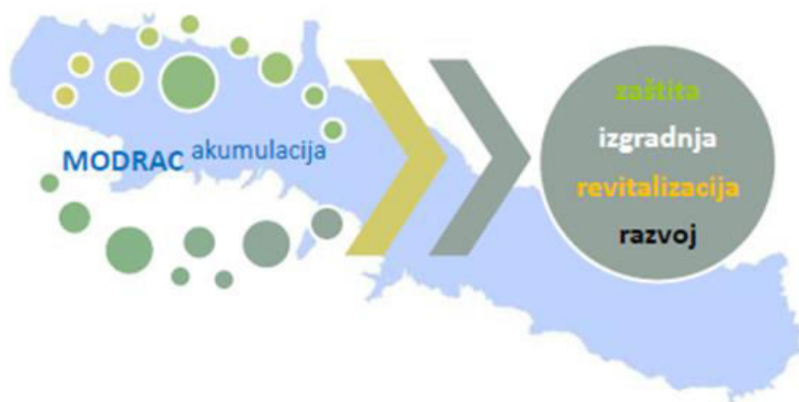
Slika 2. Modrac kao infrastrukturni sistem: prirodna, prostorna i tehnološka infrastruktura